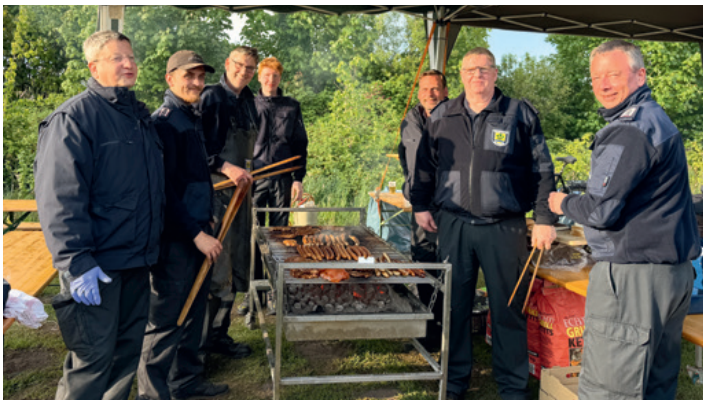
Routiniertes Grill-Team: Die Kameraden der Freiwilligen Feuerwehr Ellerbek versorgten die Besucher mit Grillfleisch und -würstchen.