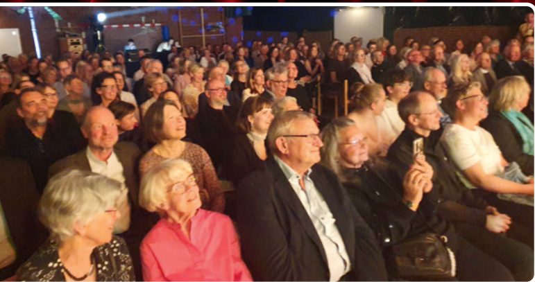
Die Zuschauer waren begeistert