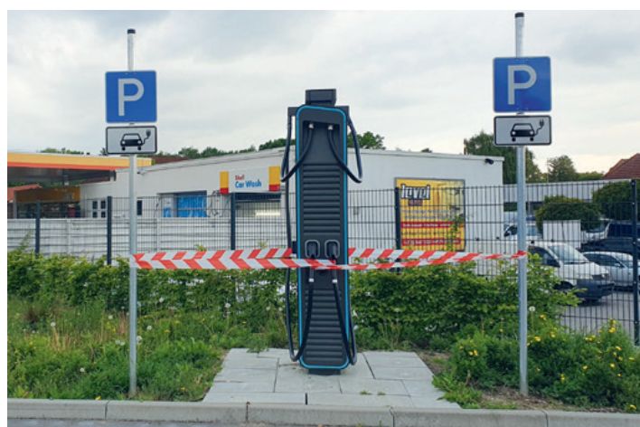
Ladesäule auf dem ALDI-Parkplatz – leider noch nicht betriebsbereit.

Mehr Infos unter: www.https://www.btc1979.de/