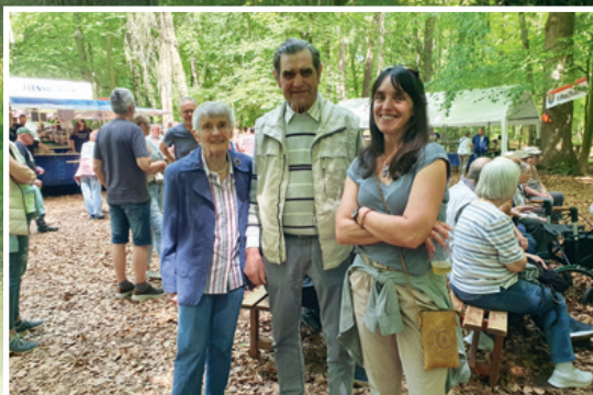
Auch die Bönningstedter genossen den sonnigen Tag im Pfingstwald