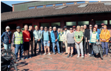
Mehr als 30 Teilnehmende trafen sich in Ellerbek zur „Tour durch das Amt Pinnau“.