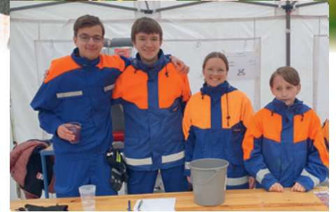
Die Jugendfeuerwehr immer aktiv dabei