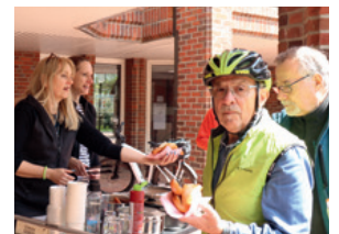
Zum Abschluss gab es einen Imbiss vor dem Rellinger Rathaus.

Drainagespülung | Kanalreinigung Wurzelfräsen | Pumptechnik Hochdruckspülen | Rohrkamera Verstopfungsbeseitigung