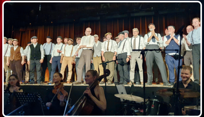
Im Chor stehen keine professionellen Opernsänger, sondern Männer aus dem Ort.