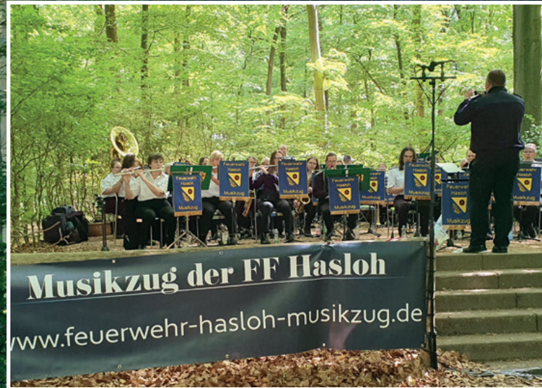
Der Musikzug präsentierte ein abwechslungsreiches Programm

Mit einer Grillwurst und Pommes in der Hand oder einem leckeren selbstgebackenen Kuchen suchte man sich ein kühles Plätzchen, um die Musik zu genießen. In den Pausen wurde lebhaft mit den Nachbarn und Freunden geklönt. Eine schöne Tradition, die Jung und Alt zusammenbringt im Wald.