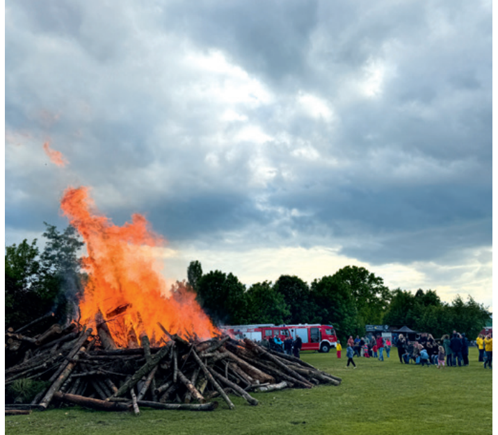
Ellerbeker Maifeuer 2026