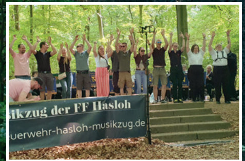
„Wir haben .... gute Laune“ – demonstrierten die Kameraden der Bilsener Feuerwehr