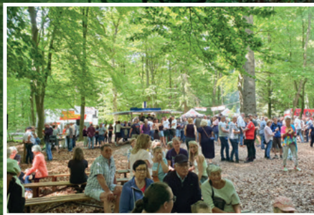
Richtig was los im Wald!