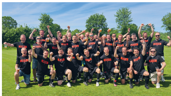
So seh'n „Meister“ aus! Glückliche Gesichter nach dem Sieg der Ü40 Rugenbergen/Halstenbek-Rellingen