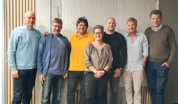
Neuer BTC-Vorstand 2026

Ihr wollt Tennis spielen und sucht nach einem Verein, in dem ihr schnell Anschluss findet? Dann seid ihr hier genau richtig. Neue Mitglieder nehmen wir gerne in unsere Teams auf und integrieren sie.