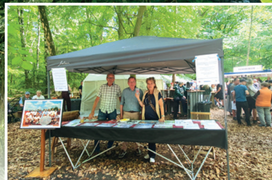
Gesichtswerkstatt Hasloh e.V. präsentierte den Verein vor Ort