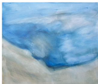
Öömrang Blaa Amrum Blau + andere Dieter Freywald

Kieler Straße 101a 25474 Bönningstedt Telefon: 040-780 12 100 Email: clarisch@larisch-immobilien.de www.larisch-immobilien.de