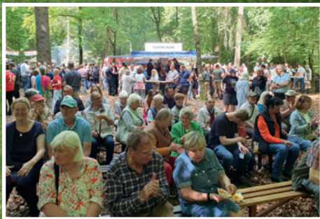
Die Plätze vor dem Konzert waren schnell besetzt