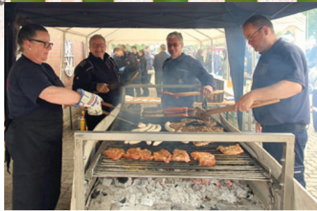
Die Freiwillige Feuerwehr mit ihren legendären Grillspezialitäten