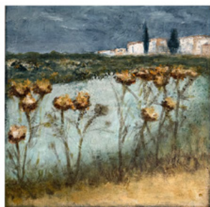
Acrylmalerei + Collagen Gabriele Schramm