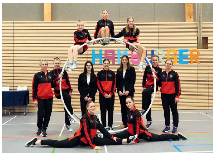
Die erfolgreichen Rhönrad-Sportlerinnen haben ein spannendes Jahr vor sich.

Von den Hamburger Meisterschaften der Rhönradsparte bis zur zweiten Auflage des internationalen Jugendfußballturniers „Hamburg City Cup“.