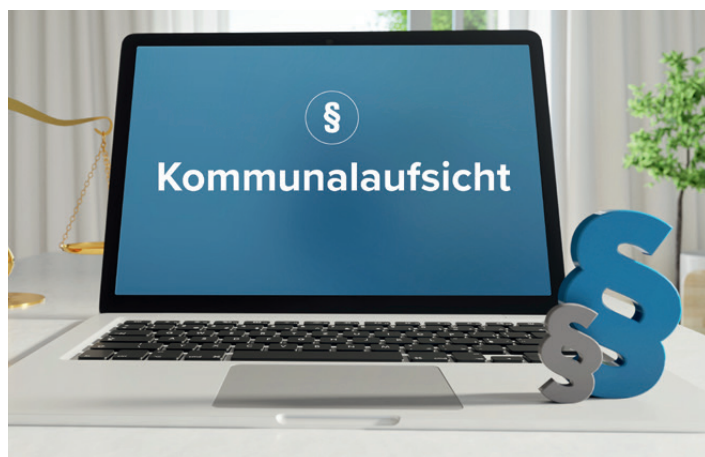
Die Kommunalaufsicht hat den Ellerbeker Haushaltsentwurf für 2026 nicht genehmigt

Die Gemeinde Ellerbek steht zu Beginn des Jahres ohne genehmigten Haushaltsplan für 2026 da. Die zuständige Kommunalaufsicht hat den Ende 2025 eingereichten Entwurf nicht genehmigt. Die Folge: Wichtige Projekte und finanzielle Entscheidungen müssen derzeit vertagt werden. Jetzt zeichnet sich eine Lösung ab.