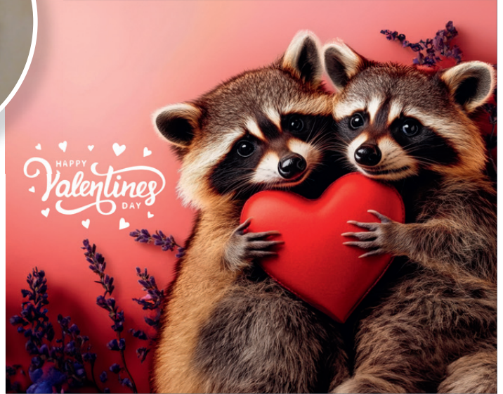
Am 14. Februar 2026 ist Valentinstag