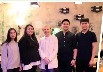
Von links: Gutgelauntes Orga-Team des Restaurants Panda's Stube