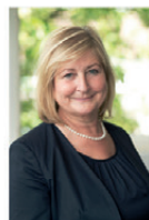
Rechtsanwältin Fachanwältin für Familienrecht Notarin

Telefon 04101 333 56 www.wiechers-jahn.de