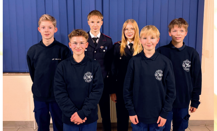
Der neu gewählte Vorstand der Jugendfeuerwehr