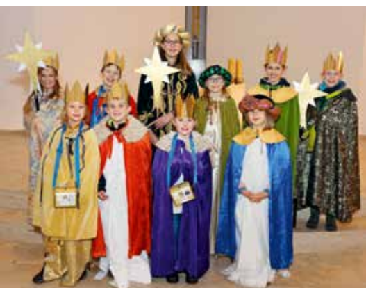
Sternsinger 2022

Wer den Besuch der Sternsinger wünscht, kann dies im Pfarrbüro 04106-2422, oder per E-Mail gemeindebuero.quickborn@pfarreihlmarin.de anmelden.