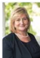
Rechtsanwältin Fachanwältin für Familienrecht Notarin

Individuelle, auf Ihre persönlichen Wünsche und Vorstellungen eingehende Rechtsberatung