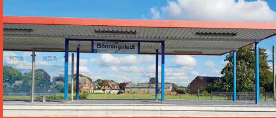
S21 Eidelstedt bis Kaltenkirchen – Fertigstellung voraussichtlich Ende 2028 Die Bahnsteigerhöhung in Bönningstedt ist bereits erfolgt.