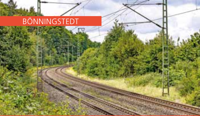
Die AKN darf die neue S5 über eine Oberleitungsanlage elektrifizieren (Symbolfoto)