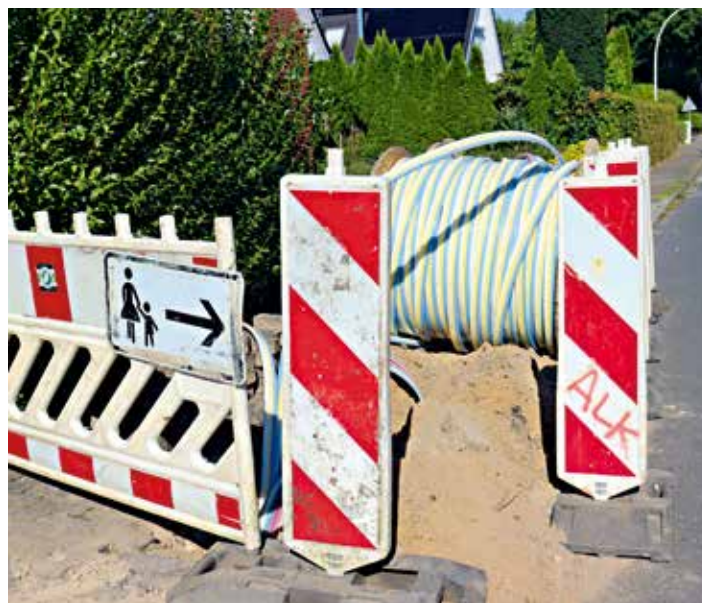
Glasfaserkabel-Verlegung im Moordammgebiet.

burg müssen sich die Hälfte der Haushalte im Alt-Dorf für einen Glasfaseranschluss und Anbieterwechsel zu Wilhelm.tel entscheiden, damit das Unternehmen die Kosten für den Breitbandausbau übernimmt. Wenn Ende März 2024 die benötigte Quote erreicht sei, könne der Ausbau im Herbst 2024 starten. tk